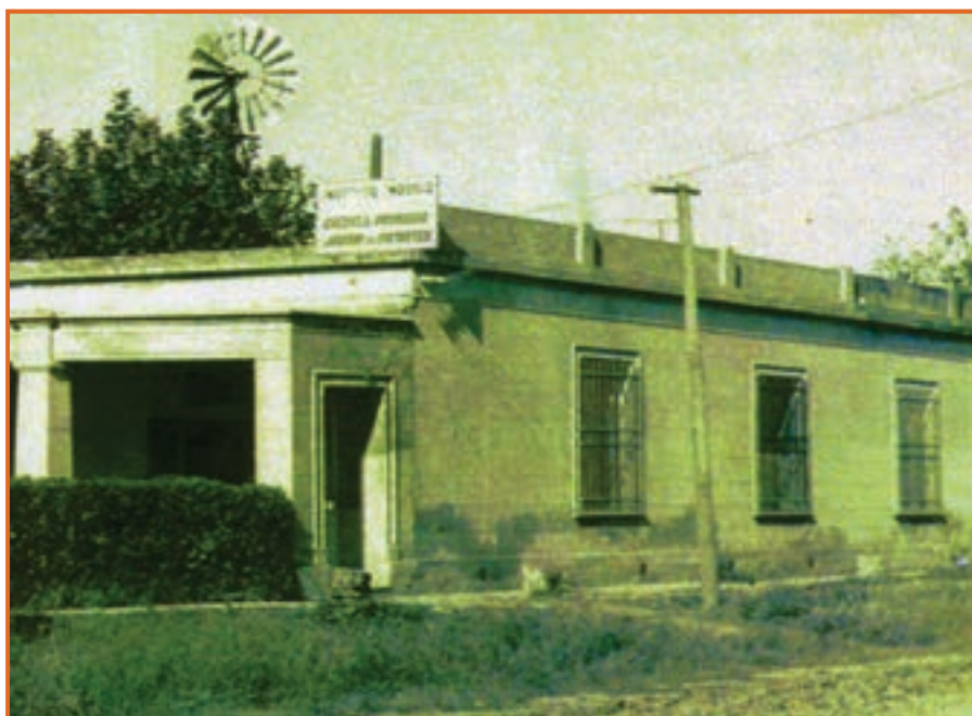
Primer edificio del Instituto Modelo Almafuerte

Se encontraba emplazada en un terreno no muy céntrico, teniendo en cuenta la fecha de su fundación, (1959), con calles de tierra, surcadas de profundas huellas que dejaban los vehículos en su trajinar, formando a su paso una estela de semicírculos que empolvaban los pastos. Acompañaban los alrededores de esta casona un caserío muy disperso.