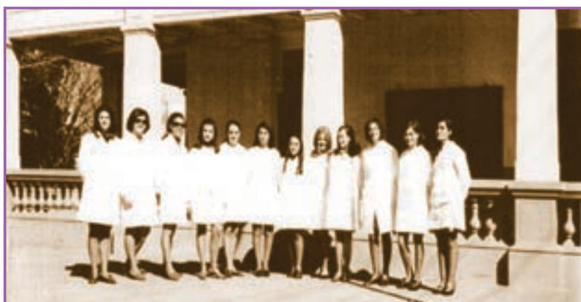
Docentes de los primeros años, posando en el patio interior. Detrás se pueden apreciar los balaustres de las amplias galerías